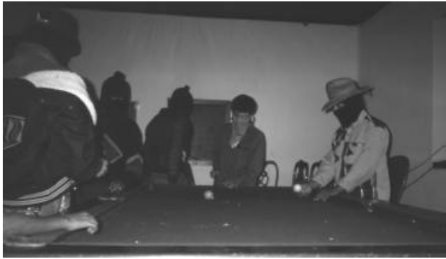
Villistas beim Billard im Herrenhaus von Liquidambar

ten. Mindestens einen Toten und sechs Verletzte hat diese Gewaltaktion zur Folge. Später wird der Finca-Besitzer mit einem zur Verstärkung gerufenen Polizeihubschrauber ausgeflogen. Sechzig Wachleute bleiben auf Prusia, bis sie unter Zurücklassung ihrer Waffen und Ausrüstung vier Tage später das Weite suchen. Prusia wird von der UCPFV wiederbesetzt. Somit sind die größten vier Kaffee-Fincas der Frailesca wieder in Händen der Villistas.