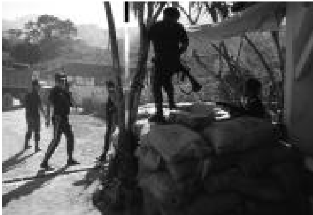
Schwerbewaffnete Privatpolizei auf Prusia