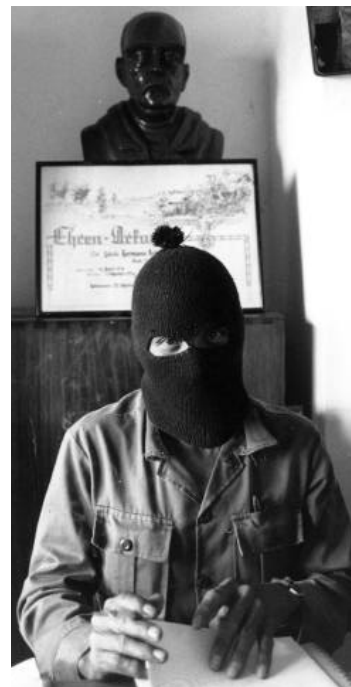
Villista im Verwaltungsgebäude von Liquidambar

Einen Teil des Kaffees verschiffte die Pacific Mail Steamship Co. direkt nach Kalifornien, den Rest – der Panamakanal wurde erst 1914 fertiggestellt – um die Südspitze Chiles herum nach Deutschland, England oder die Ostküste der USA. Nach der Jahrhundertwende nahm die Schifffahrtsgesellschaft Kosmos aus Hamburg den