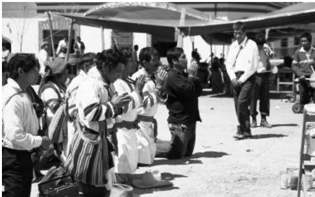
Indígenas beim Friedensgebet vor der Diözese

ganz Mexiko Hunderte von Bauernfamilien in einer lautlosen nächtlichen Demonstration durch das Tal von Aguascalientes ziehen.