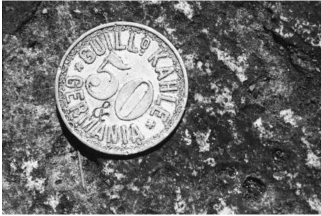
Ficha (als Lohn ausgegebene Wertmarke) der Finca Prusia

zogen. Die Preise diktierte der Finquero, Konkurrenz gab es ja keine.