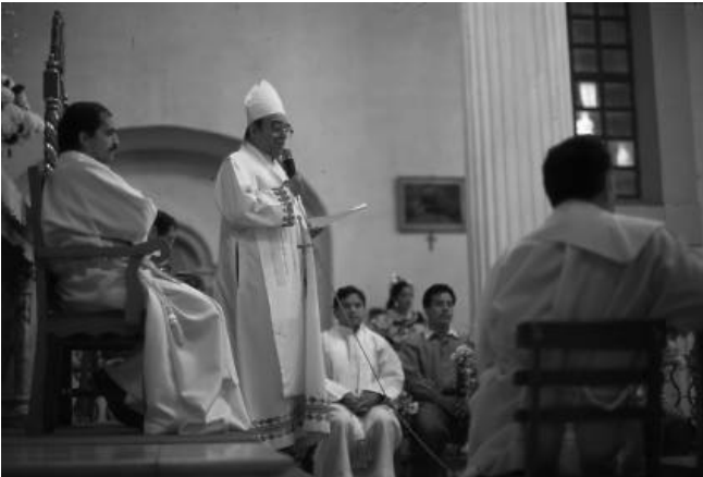
Bischof Samuel Ruíz bei einer Messe in San Cristóbal

Hektar, während 116 Kaffeebarone die Eigentümer von Plantagen über 100 Hektar sind. Unter diesen stechen einige wenige Familien mit einem Besitz von über 1000 Hektar hervor, darunter die Schimpf-Hudlers und die von Knoops. Beachtlich ist die Konzentration des Großgrundbesitzes in Chiapas und dort vor allem im Soconusco und der Frailesca, wo die deutschen Kolonisten ihre neue Heimat gefunden haben. Über die Hälfte aller Kaffee-Großgrundbesitzer Mexikos kommen aus diesen Regionen. In Chiapas werden über 30 % des mexikanischen Kaffees geerntet. Bei all den Zahlen über die Landverteilung sollte darauf geachtet werden, daß sie offiziell sind und daher viele der illegal zusammengelegten Latifundien nicht berücksichtigen. Nur 16 % der Anbauer fahren in Mexiko 70 % der Ernte ein, darunter die deutschen Kaffeebarone mit ihren privilegierten Lieferkanälen in die einstige Heimat. Sie leiden am wenigsten unter der Preiskrise.