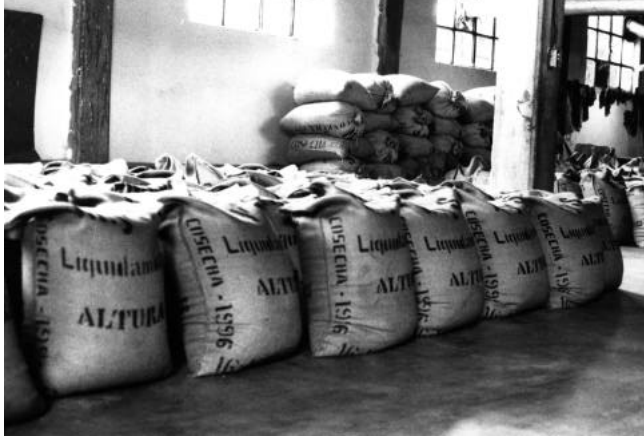
Kaffeesäcke der Ernte 1996 auf Liquidambar