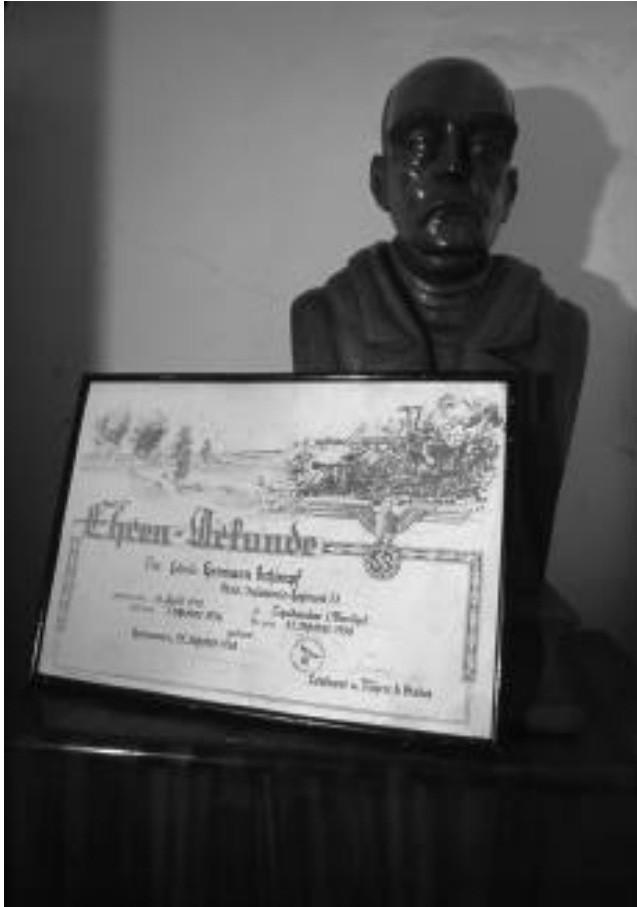
Bismarck-Büste und Hakenkreuz-Urkunde im Büro von Liquidambar

»Um richtig einzuschätzen, was der Kaffee für diese Küste leisten könnte, reicht es, sich daran zu erinnern, wie Guatemala vor zwanzig Jahren war, und es sich heute anzuschauen. Unbevölkerte Regionen haben sich urplötzlich in gut kultiviertes Ackerland verwandelt. Dörfer und Städte im Niedergang haben sich auf wundersame Art erhoben und bereichern sich immer schneller. Der Handel wächst und das Staatseinkommen steigt an. Die Regierung wird kreditwürdig. Und was vor kurzer Zeit ein niedergehendes, armes, fast ruiniertes Volk war, hat sich dank der einträglichen Ergebnisse des Kaffeeanbaus in einen reichen und florierenden Staat verwandelt. Ich sehe keinen Grund, warum Chiapas nicht das gleiche Ergebnis erreichen könnte, wenn es denselben Weg einschlägt.«