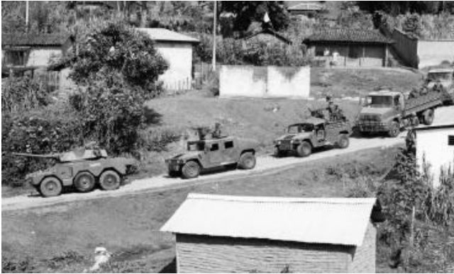
Vermummte Guardias Blancas im Jeep ohne Kennzeichen patrouillieren in Nueva Palestina