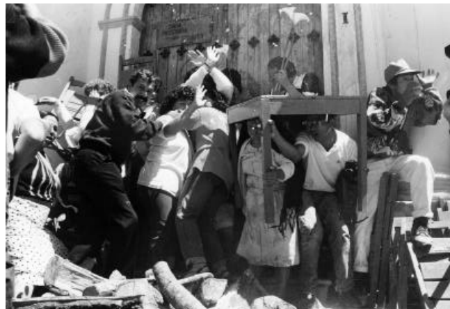
Friedensgruppen wehren sich gegen Angriffe gewalttätiger Großgrundbesitzer vor der Diözese in San Cristóbal