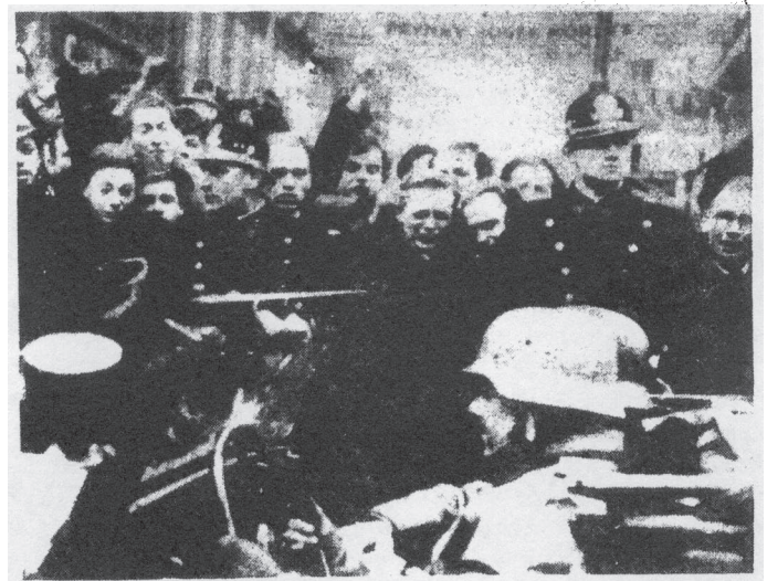
Okkupation der Tschechoslowakei: Einheiten der faschistischen Wehrmacht besetzen Prag, 15. März 1939

Bei der Dreiteilung des ‚europäischen Großwirtschaftsraums‘ in entwickeltes Machtzentrum, umgebenden Industrialisierungsgürtel und Zwangsarbeiter liefernde süd-, südost- und osteuropäische Peripherie 24 war das ‚Protektorat‘ aufgrund seines hohen Industrialisierungsgrads dem Zentrum zugeschlagen worden. Es kam also darauf an, eine langfristige Germanisierungskonzeption mit dem tagespolitischen Zwang zur effektiven kriegswirtschaftlichen Ausnutzung des Arbeitskräftepotentials in Einklang zu bringen. Dabei gingen Heydrich und die Protektoratsgruppe der RGI von übereinstimmenden Prinzipien aus. Ihr gemeinsamer Rassismus transformierte sich immer mehr in einen Hebel der Klassenspaltung von innen heraus; er wurde zum Scharnier, mit dessen Hilfe die Geschmeidigkeit der alltäglichen Ausbeutung in das große Projekt der Germanisierung hinüberführte. Es ist von entscheidender Bedeutung, zu begreifen, daß jetzt die Hingabebereitschaft als Arbeitskraft die Werteskala des Rassismus definierte. Slawische Untermenschen zeichneten sich fortan vor allem durch „deutlich ungeordnetes, unsorgfältiges Familienleben bei Mangel jeglichen Gefühls für Ordnung, für persönliche und häusliche Sauberkeit, Mangel