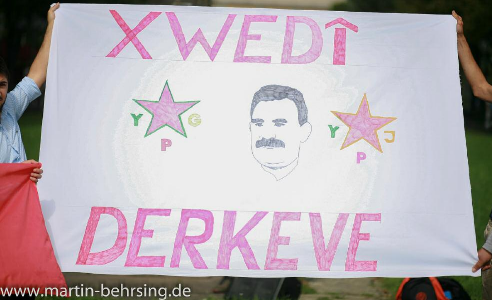
XWEDİ DERKEVE: Steh zu dir: eine Kampagne der YXK (Vereinigung der Studierenden aus Kurdistan), hier gesehen auf der Kundgebung gegen Krieg und PKK-verbot am 29.8. in Bonn

habe Ende letzten Jahres im kurdischen Verein an einer „Trauerfeier für einen gefallenen PKK-Guerilla“ teilgenommen. Bei dieser Veranstaltung habe ein Redner die „Märtyrer als Licht auf dem Weg zu einem freien Kurdistan“ gepriesen.