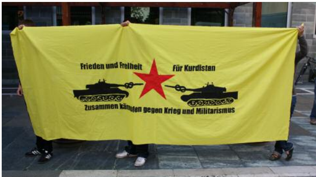
TATORT Kurdistan am 1. September 2010 in Heilbronn

Die Kritischen JuristInnen der Berliner Freien und der Humboldt-Universität haben in diesem Jahr