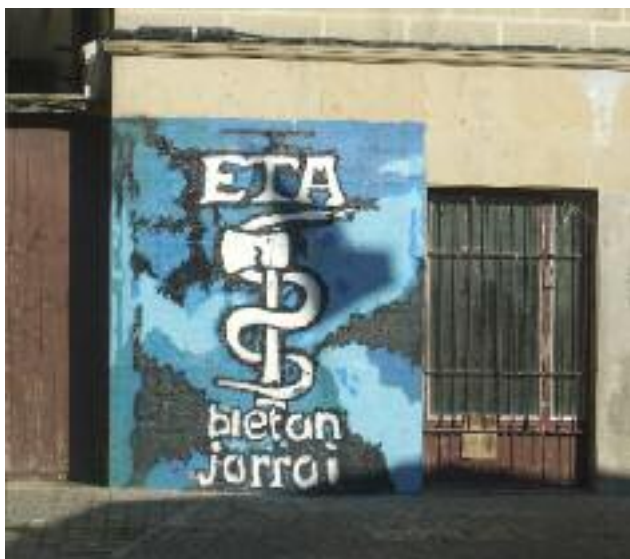
Hauswand in Altassio

Mit 8,93 Millionen Euro will die Europäische Union die Palästinensische Autonomiebehörde (PA) unterstützen. „Mit dieser neunten monatlichen Zahlung der EU können Gehälter und Pensionen an die 84 000 PA-Angestellten ausgezahlt werden“, erklärte der EU-Vertreter Christian Berger in Jerusalem. Die EU hoffe, dass die PA darauf hinarbeitet, im kommenden Jahr auf eigenen Füßen zu stehen.